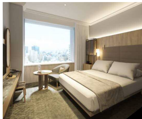
<モデレートダブル>