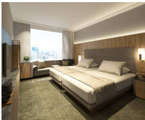
<スーパーアツイン>

総客室数 243 室。ツインタイプの客室を従来の 12 室から 51 室へと増やし、増加する観光・レジャーのゲストニーズに対応するとともに、ベッドをサイズアップし、より快適な滞在空間を実現します。客室の随所に設えた優しく温かみのある天然木と、高級感を感じさせるレザーや大理石などによる素材の組み合わせの妙をお楽しみいただけます。また薩摩藩の定め小紋である「大小あられ」や切子細工のカッティング柄等をインテリアデザインの随所に取り入れ、当ホテルならではの上質な空間をご提供します。