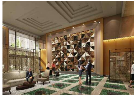
<ロビー:壁面アート「KIRIKO WALL」>