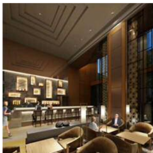
<カフェ&バーラウンジ>

これまでの上質で落ち着いたイメージを継承しつつ、新たなロビー空間として生まれ変わります。「カフェ&バーラウンジ」を併設し、一日の様々なシーンにおいてそれぞれの寛ぎ方、過ごし方ができる空間といたします。江戸小紋をモチーフにした間仕切り「KOMMON SCREEN」や切子細工を表現した壁面アート「KIRIKO WALL」など、歴史あるこの土地の記憶を思い起こさせる粋なインテリアがゲストをお迎えいたします。