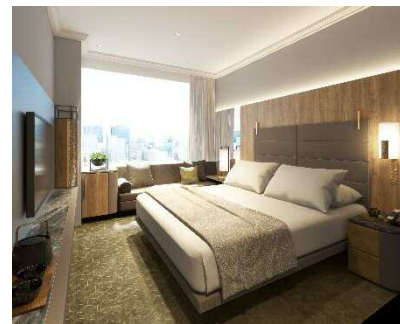
<スーペリアダブル>